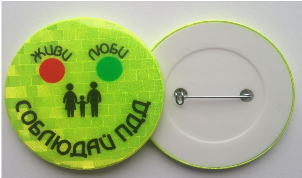
Рис. 3. Световозвращающий значок.