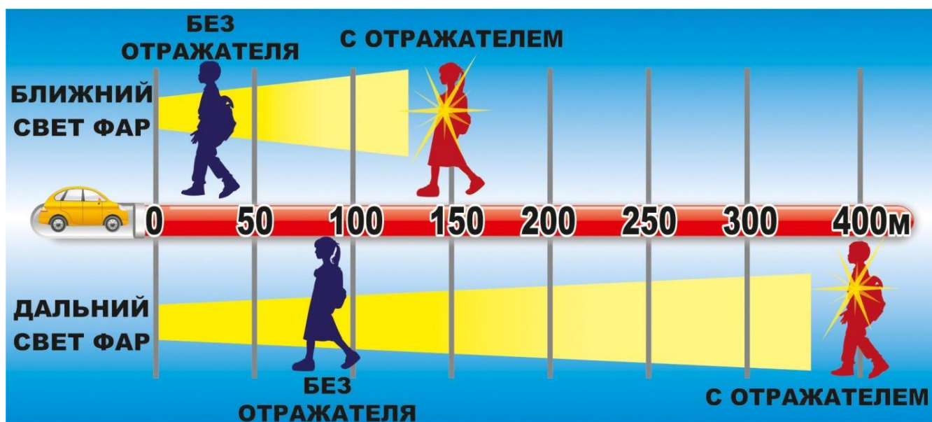
Рисунок 1. Дальность обнаружения человека при различных условиях

метров. Это означает, что водитель имеет гораздо больше времени, чтобы отреагировать на ситуацию с пешеходом.