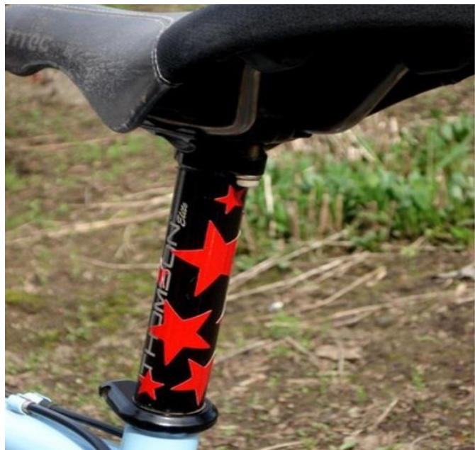
Рис. 4. Световозвращающие наклейки.