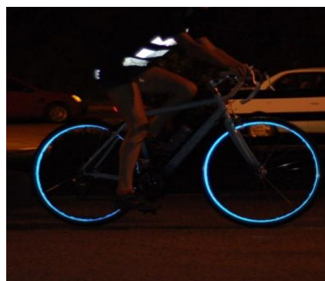
Рис. 10. Нашивки из световозвращающей ленты