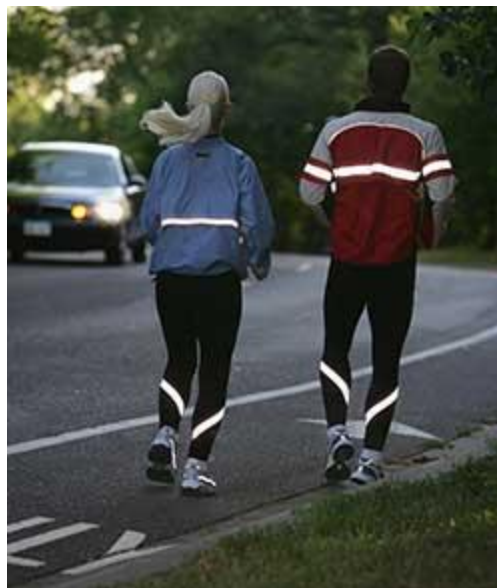
Рис.6. Несъемные световозвращающие элементы