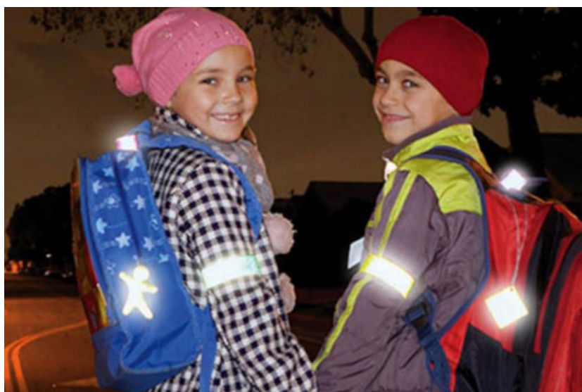
Рис. 8. Размещение световозвращающих элементов

Световозвращающие элементы (наклейки, брелоки, браслеты) могут располагаться на одежде в любом месте, а также на сумках, рюкзаках или портфелях (Рис. 8).