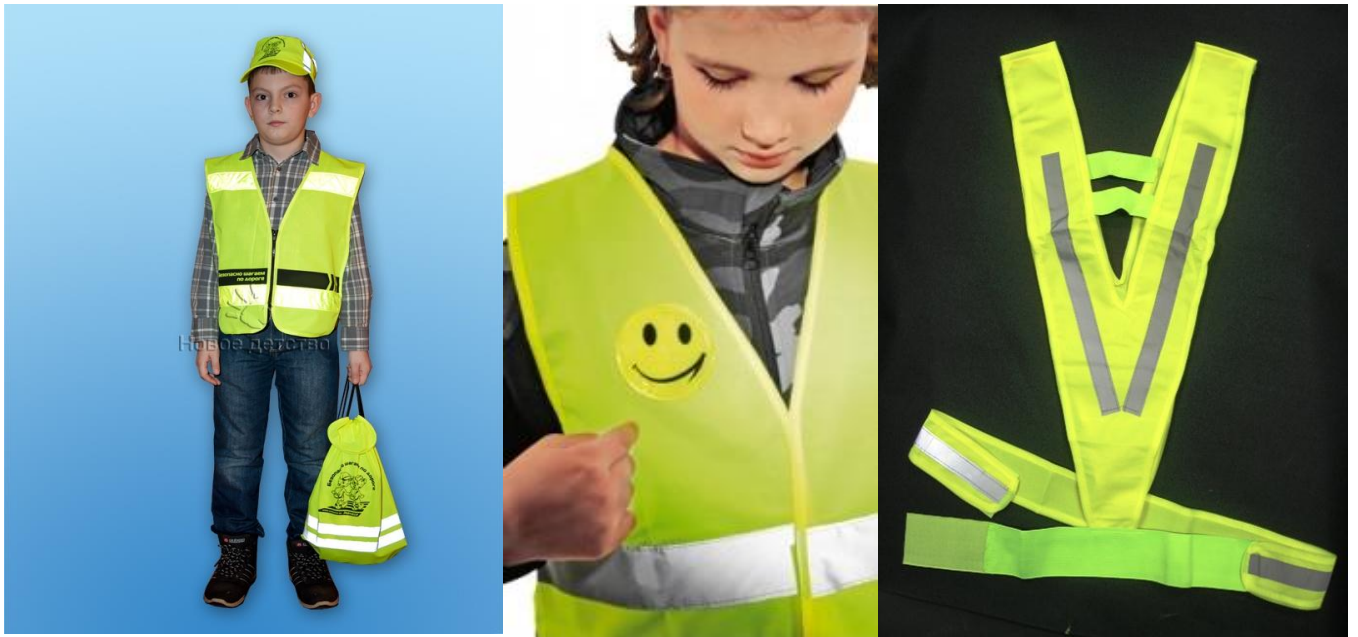
Рис.5. Сигнальные жилеты и ременные системы